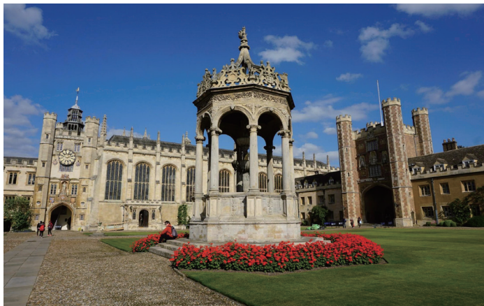
剑桥大学三一学院 5 （由亨利八世创建于1546年）

罗素1872年5月18日出生于蒙默斯郡一个贵族家庭，比怀特海小11岁。他于1890年进入剑桥大学三一学院学习数学，当时怀特海已经留校任教多年，碰巧是罗素申请大学生入学奖学金考试的阅卷人。尽管罗素考卷分数没有达标，但怀特海认为他的论文比卷面成绩展示出更加突出的优点，从而说服考官同仁们破格授予罗素入学奖学金资格。1895年罗素大学毕业，跟怀特海一样也获得三一学院理事资格。罗素的理事资格论文题目是“几何的基础”。在这一时期，罗素的哲学观充满了康德和黑格尔的色彩。