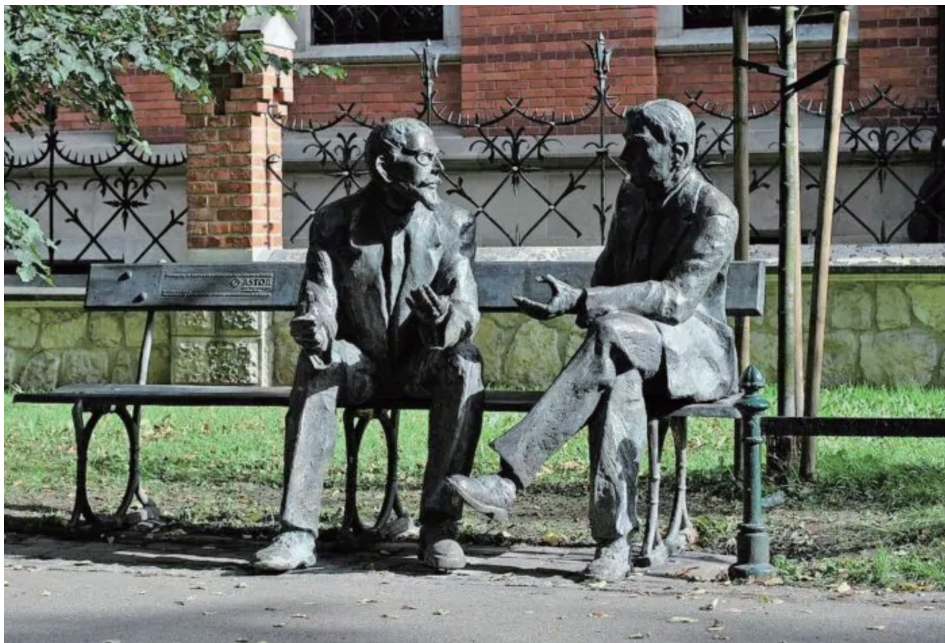
克拉科夫普兰蒂公园中尼科迪姆（左）与巴拿赫（右）的雕塑。

时间来到1916年夏天，斯坦因豪斯与巴拿赫在克拉科夫的普兰蒂公园（Planty Park）不期而遇。根据斯坦因豪斯本人的回忆，一个夏夜他在公园散步时，偶然听到“勒贝格积分”这个词。这是20世纪初法国数学家勒贝格（H. Lebesgue）等人引入的一个现代数学概念，当时还是鲜为人知的“内部”术语。斯坦因豪斯好奇地走到一条长椅旁，发现正在交谈的巴拿赫与尼科迪姆。他邀请两位年轻人到自己家中，定期讨论数学问题。不久巴拿赫与斯坦因豪斯完成了第一篇合作文章《关于傅里叶级数的平均收敛性》，两年后发表。在斯坦因豪斯的提议下创办了一个非正式的克拉科夫数学协会，1919年演变为波兰数学会，巴拿赫与尼科迪姆出席了成立会议。