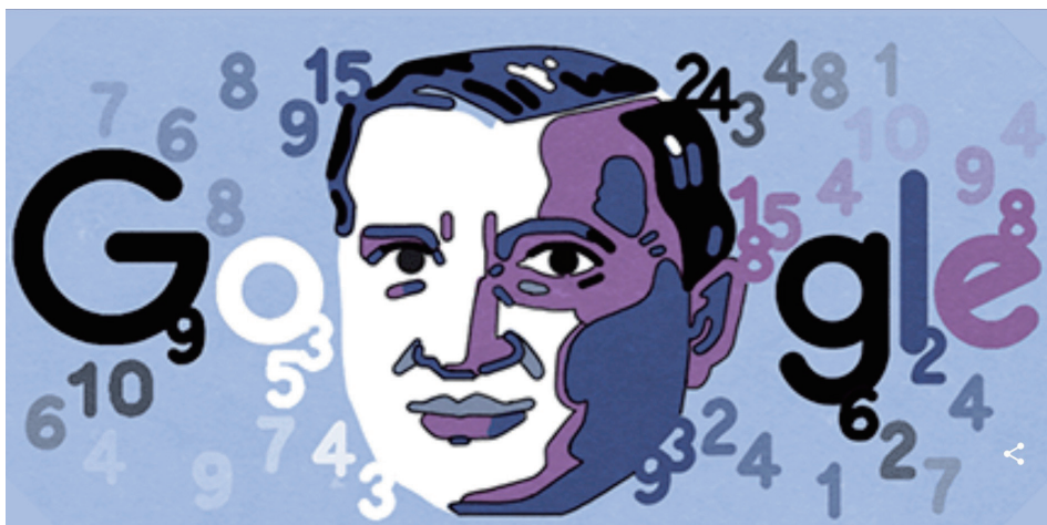
为纪念巴拿赫成为利沃夫理工学院教授，2022年7月22日发布的谷歌涂鸦。

赫是一个另类。例如他很少按照对教授的要求着正装（大概除拍照以外），而是穿短袖衬衫上街，喜欢美国西部牛仔电影，经常参加平民足球比赛。也许这与他的出身有关，但可能只是个巧合。对于巴拿赫来说，数学是世界上最重要的东西，是他唯一的真爱。巴拿赫是一位真正的艺术家，数学是他的艺术作品。他通过谈话、演讲和讨论创造了这些作品，他认为撰写论文只不过是对于创造性行为的无聊补充。