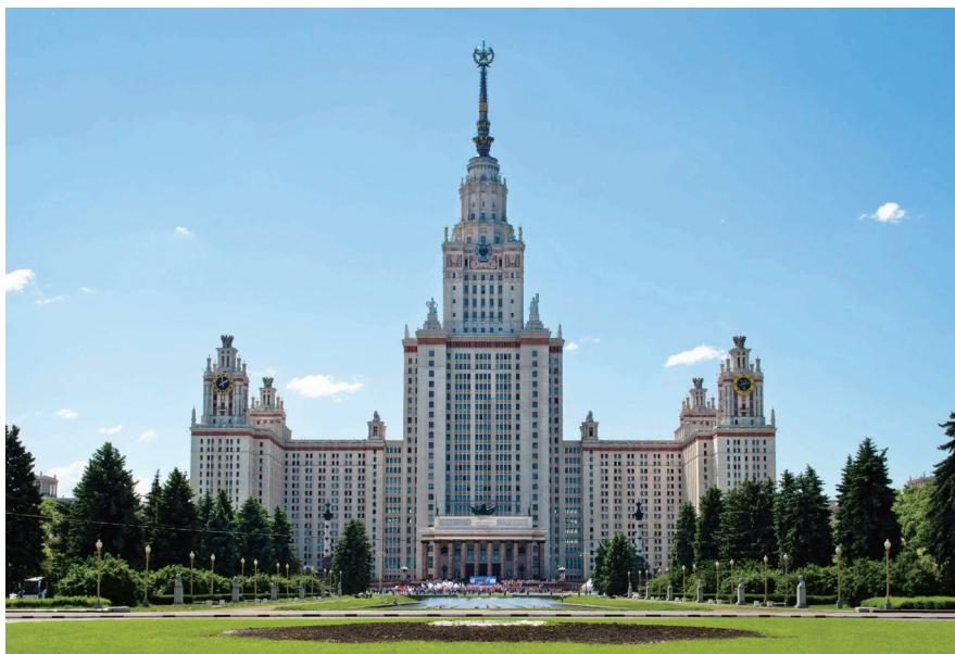
莫斯科国立大学主楼，中间为 A 区，左边是 B 区

莫斯科大学的主楼位于列宁山上（当时的名称，现称为麻雀山），从我的房间可以俯瞰蜿蜒而过的莫斯科河和 1980 年莫斯科夏季奥运会的主场馆。主楼有一万多个房间，分成若干个区域，里面有食堂、商店、邮局、游泳池、电影院、图书馆、研究生宿舍等设施，其中 A 区有学校领导办公室、多个院系的办公室和教室。1547 里面有两个独立的房间，供两位入住者使用，并有共用的卫生间和淋浴间。房间虽然不大，但这样的住宿条件我已十分的满意，因为那时中国国内的研究生不可能有这样的待遇。我的室友是来自乌兹别克斯坦的数学系研究生，为人友善，对我俄语的进步有很大的帮助，他所做的美食“手抓饭”至今让我难忘。