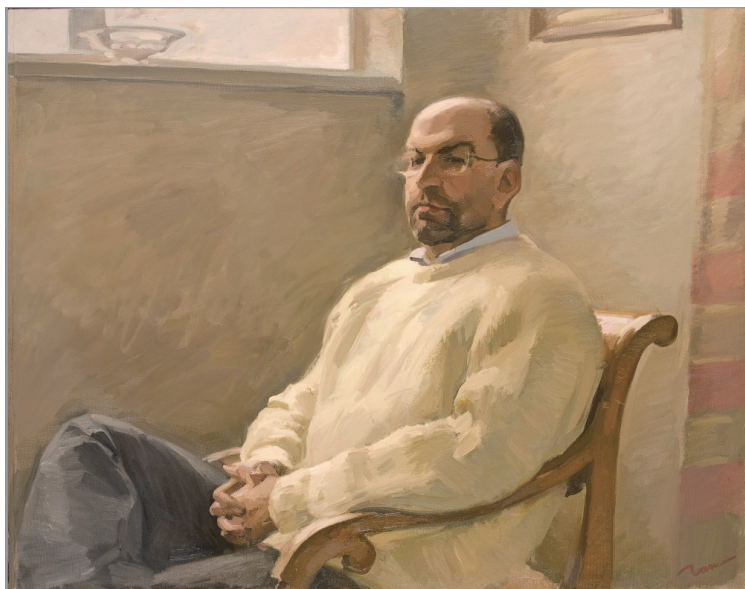
雅罗斯拉夫·谢尔盖耶夫肖像(布上油画, 德米特里·甘宁作, 2008年)