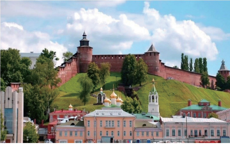
下诺夫哥罗德克里姆林宫