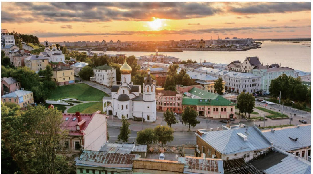
伏尔加河与奥卡河（左边）的汇合处，奥卡河是伏尔加河右岸最大的支流

下诺夫哥罗德位于莫斯科以东约 400 公里处，奥卡河在此汇入伏尔加河（欧洲最长的河流）。这座城市有一个非常美丽的老城区和多个现代工业区。