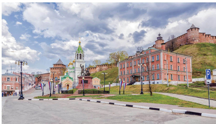
下诺夫哥罗德的库兹马·米宁和德米特里·波扎尔斯基王子纪念碑是一个较小的复制品，同样位于克里姆林宫附近

在俄罗斯帝国时期，下诺夫哥罗德是全国主要的贸易中心，被称为“俄罗斯的口袋”。1896年，这座城市举办了最大的全俄展览会。向前走一步，请允许我讲一个有关这个展览会与我在意大利第一年的有趣的故事。当我刚来到意大利南方的卡拉布里亚时，那里的俄罗斯人还很少。在苏联时代，我们去那不勒斯以南旅行必须获得意大利政府的特别许可。这可能与某种军事原因有关。因此，当我来到卡拉布里亚时，卡拉布里亚人觉得与苏联人交谈很新奇，我也对与他们交谈很感兴趣。有一天，我遇到一位医生（现在我们是好朋友），他