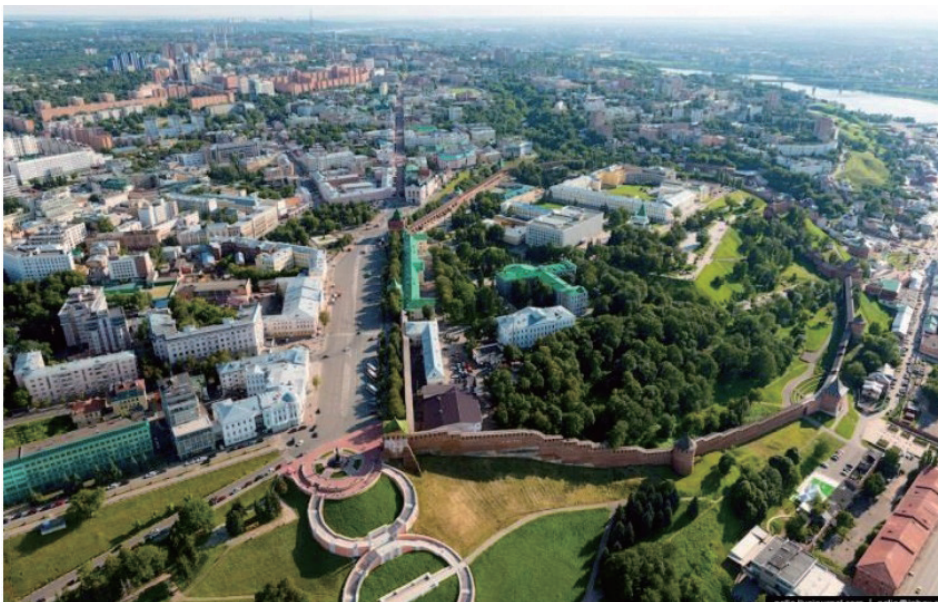
下诺夫哥罗德克里姆林宫鸟瞰图

下诺夫哥罗德有一个重要的历史时刻。1611年，由库兹马·米宁和德米特里·波扎尔斯基王子领导的市民们筹集资金，组建军队，将莫斯科从波兰人手中解放出来。为了纪念这一事件，自2005年以来，莫斯科红场上竖立了一座纪念碑。11月4日成为俄罗斯的全国性假日——民族团结日。让我们回忆一下，在苏联时期，人们庆祝的主要节日是11月7日。这个日子是纪念伟大的十月革命。这一事件发生在儒历1917年10月25日，改为公历以后，便是1917年11月7日。