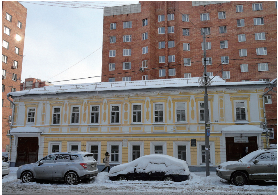
制图员谢尔盖耶夫的房子，马克西姆·高尔基生活和工作过的地方

下诺夫哥罗德位于莫斯科以东约 400 公里处，奥卡河在此汇入伏尔加河（欧洲最长的河流）。这座城市有一个非常美丽的老城区和多个现代工业区。