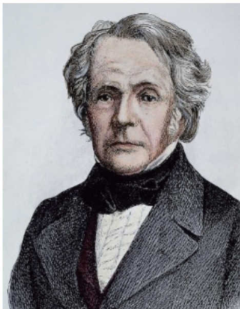
图 1. 未毕晚年肖像。一位个子不高、微胖、朴实、终身勤奋的天文学家兼数学家

童年缺少友伴，对普鲁士军国主义的不屑，使他生性孤僻内向，不善言谈。他的笨拙口才让一些本来对他的课程感兴趣的付费学生望而却步，不愿上他的课。因此，为了招收一些学生，他不得不免费提供课程。这让人想起其他曾经穷困潦倒的伟人。例如，很少有学生去听牛顿在剑桥的演讲，以至于他经常只好面壁朗读。麦克斯韦在剑桥的听众很少，绝不超过六名。未毕从 1816 年在