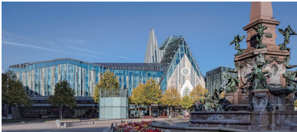
图 2. 莱比锡大学，这里产生过莱布尼兹、哥德、尼采等对人类文明有重要贡献的人！