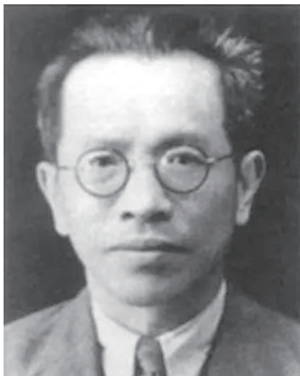
新中国数学会首任会长 姜立夫