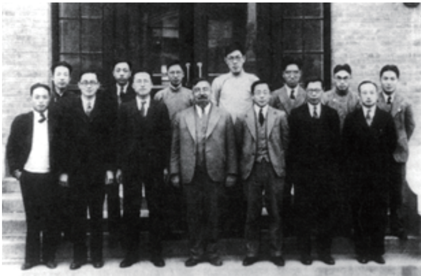
维纳与清华大学电机系人员合影，前排左二李郁荣，左三顾毓琇，左四维纳

布什和微分分析仪与中国也有渊源。1935年，维纳（N. Wiener）受李郁荣的邀请到清华大学担任研究教授，主要在数学系和电机工程系工作。李郁荣是布什在麻省理工学院培养的博士，在攻读博士期间，布什将其推荐至数学系维纳处，二人合作发明了现在被称为“李-维纳网络”（Lee-Wiener network）的专利 14 。李郁荣在给维纳的邀请信中还提及曾远荣与赵访熊 15 ，巧合的是，此二人日后都成为中国计算数学发展过程中的重要人物。