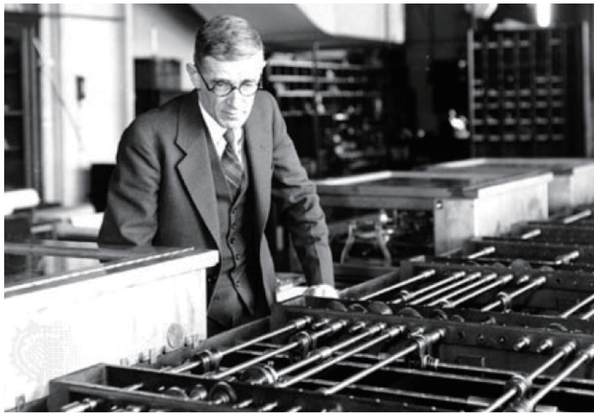
布什与他的微分分析仪

率等于原波动频率整数倍的谐波（即 \sum_{n=1}^{\infty} a_n \sin(\frac{2n\pi}{T}x + \varphi_n) ）。亨里奇发明的谐波分析仪最初就是用来测定复合声波中的基波和谐波的，后来被广泛应用于电路中。