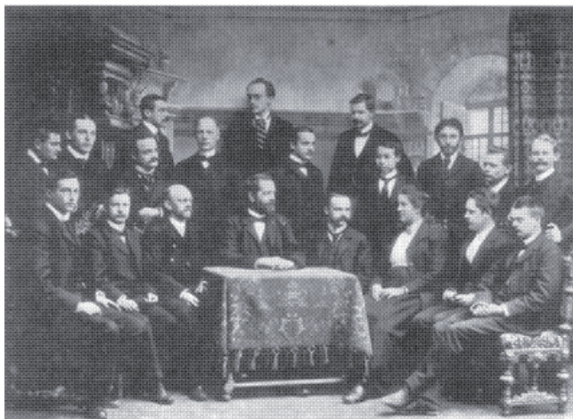
1902 年哥廷根数学系部分师生合影，前排左四为克莱因，左三为希尔伯特

“我为这里和柏林不同感到吃惊，这里是来自世界各国的少壮派集合，实际上，这里是数学世界的中心。” 3