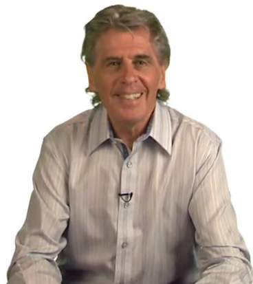
斯坦福大学 Devlin 讲数学思想 (Coursera 课程)

危机中，福岛核电站的程序员用在吴恩达的“机器学习”课程中学到的算法，在一定程度上缓解了核泄漏危机。谈到网络开放教育的作用，科勒认为有三点：“一，教育成为了人们基本的权利；二，终身学习成为可能；三，打开了创新之门，因为不可思议的人才在世界各地都同样存在。”