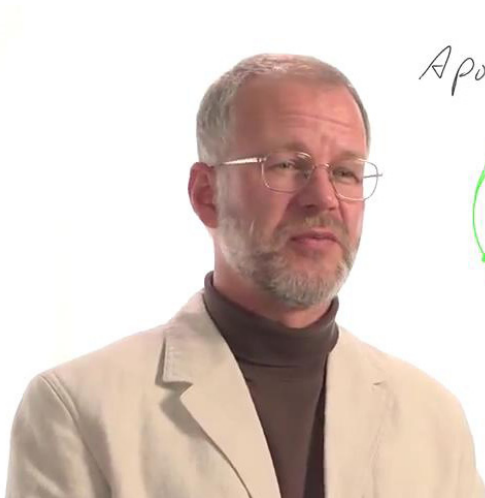
Udacity公司 Loviscach 讲微分方程