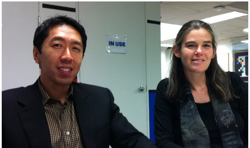
吴恩达 (左) 与科勒

几乎与 Udacity 同时，2012 年 4 月，特龙的同事科勒 (Daphne Koller) 教授和吴恩达 (Andrew Ng) 副教授成立了名为“Coursera”的网络教育公司 (www.coursera.org)。他们与普林斯顿大学、斯坦福大学、布朗大学、哥伦比亚大学、爱丁堡大学、多伦多大学、洛桑联邦理工学院、香港科技大学等几十所名校联手，开设了计算机、数学、商务、医学、工程等专业的 200 多门课程，有来自近两百个国家的一百多万学生注册学习。很多学生通过 Coursera 学到了新的知识，找到了更好的工作，提高了生活质量。在 2011 年日本大地震和海啸