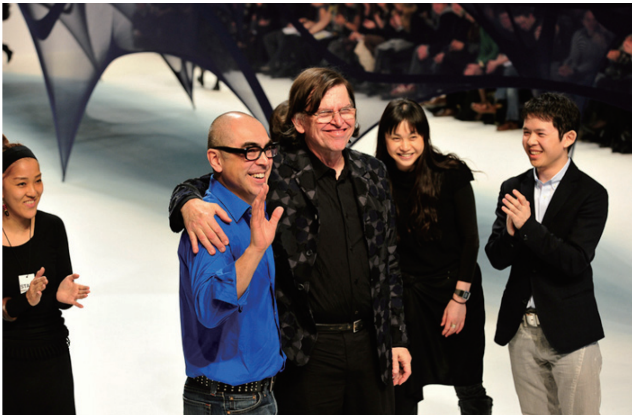
瑟斯顿在 2010 年的巴黎时装秀

辑的结构。很难说这本书到底适合有一定数学成熟性的人还是更适合初学者。很多证明和想法能让没有太多数学背景的人接受。比如第一章，只有一个公式和极少的数学符号，满篇都是文字说明和示意图。但书里的练习题和思考题真是又多又难。此书的原型是瑟斯顿的研究笔记。书里的内容大致相当于笔记的前三节的扩充。而笔记本身经过整理至少有十三节，越往后越艰深。1997 年这本书出版的时候，这些笔记已经在圈内人中流传了 20 多年。可惜的是，瑟斯顿本人并没有足够的动力去完成把研究笔记完全整理成书的工作。他的笔记固然已经十分可贵，《三维的几何与拓扑》这本书更添精彩。倘若十三节笔记都能由他本人成书，从而完全展现瑟斯顿数学思想的细节，将是数学人何等大幸。