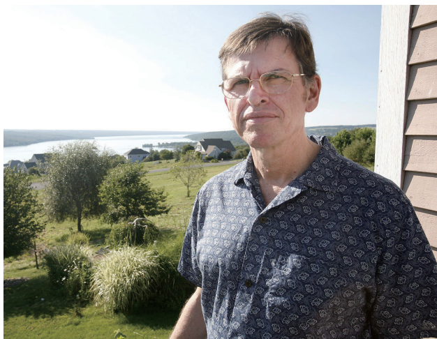
低维拓扑学研究的领袖人物之一瑟斯顿

本文翻译自陶哲轩的博客，原文见 http://terrytao.wordpress.com/2012/08/22/bill-thurston/ 。