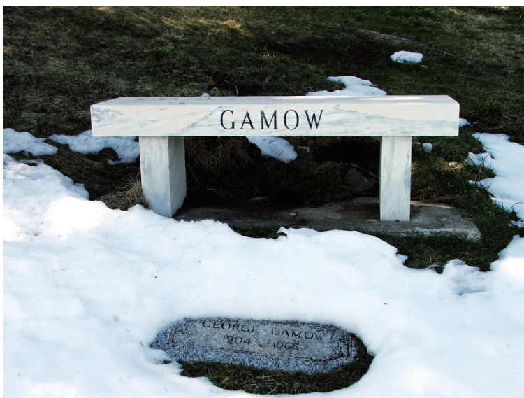
乔治·伽莫夫的墓位于科罗拉多州