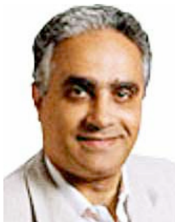
塔西尔·埃尔格莫尔（1955-）

还有一个很常用的公钥系统是由塔西尔·埃尔格莫尔（Taher Elgamal）在 1984 年提出来的。这套系统主要用群论和复杂性的知识来保证安全。