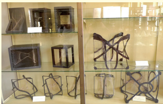
哥廷根数学研究所第三层的数学模型

蒂博 (B. F. Thibaut, 1775-1832), 1797 年任哥廷根讲师, 1805 年任教授。高斯一生厌恶教学, 没有多少学生,