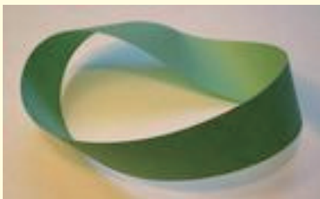
莫比乌斯带最早是由利斯亭于 1861 年发现的，4 年后莫比乌斯才对此作了描述。恰当的名字应该是利斯亭带，现在为其正名为时已晚