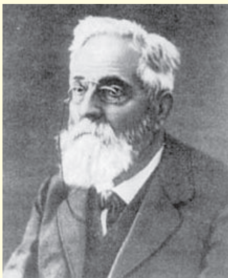
H. 韦伯 (1842-1913)