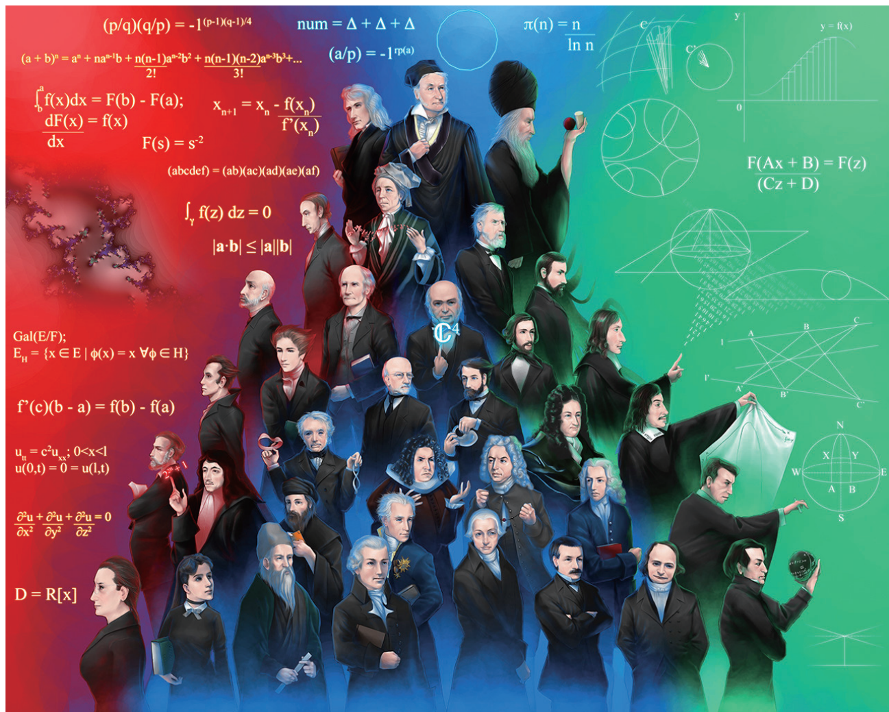
数学家群星图；排在最上面的是数论结果及高斯和欧拉等数论先驱

上面的筛法虽然可以逐一列出不超过某个上限 N 的全部素数，但是当 N 很大时，其工作量也是巨大的。因此人们开始寻找其他方法来构造素数。通常的思路是构造一个有规律的数列 \{a_n\}_{n=1}^{\infty} ，使得数列中每一项都是素数。这样的数列称作素数公式。比如费马构造了以下数列（费马数），并