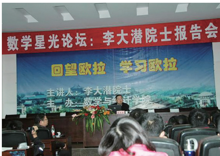
复旦大学李大潜院士给大学生做数学文化讲座