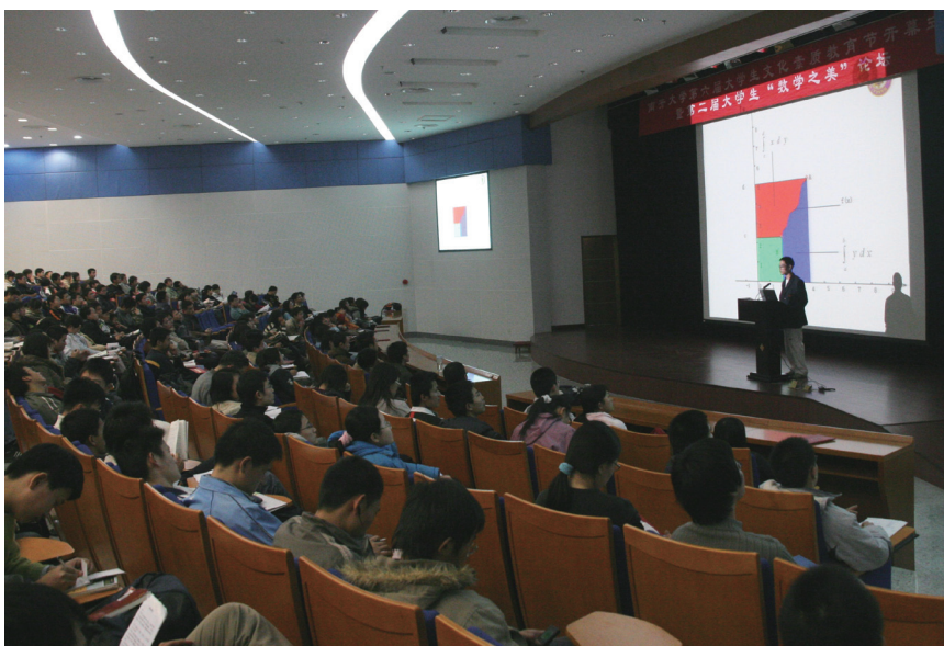
南开大学“数学之美”论坛现场

由于“数学文化”一词使用的时间还不长，目前还没有看到哪本词典对其给出多数学者共识的定义。南开大学的“数学文化”课程，在“序言”课中对“数学文化”一词的内涵给出了狭义的和广义的两种解释：狭义的数学文