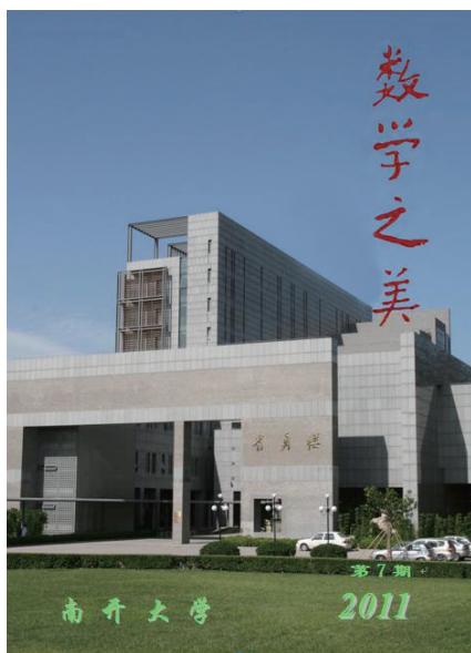
南开大学的校内刊物：《数学之美》