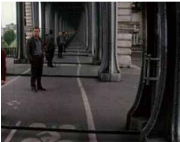
图 3. 电影中的位似视觉

距离和角等概念，并利用电影中迷宫的特点，让学生类比现实空间，探索球面上距离的求法，球面三角形的性质及正余弦定理等。