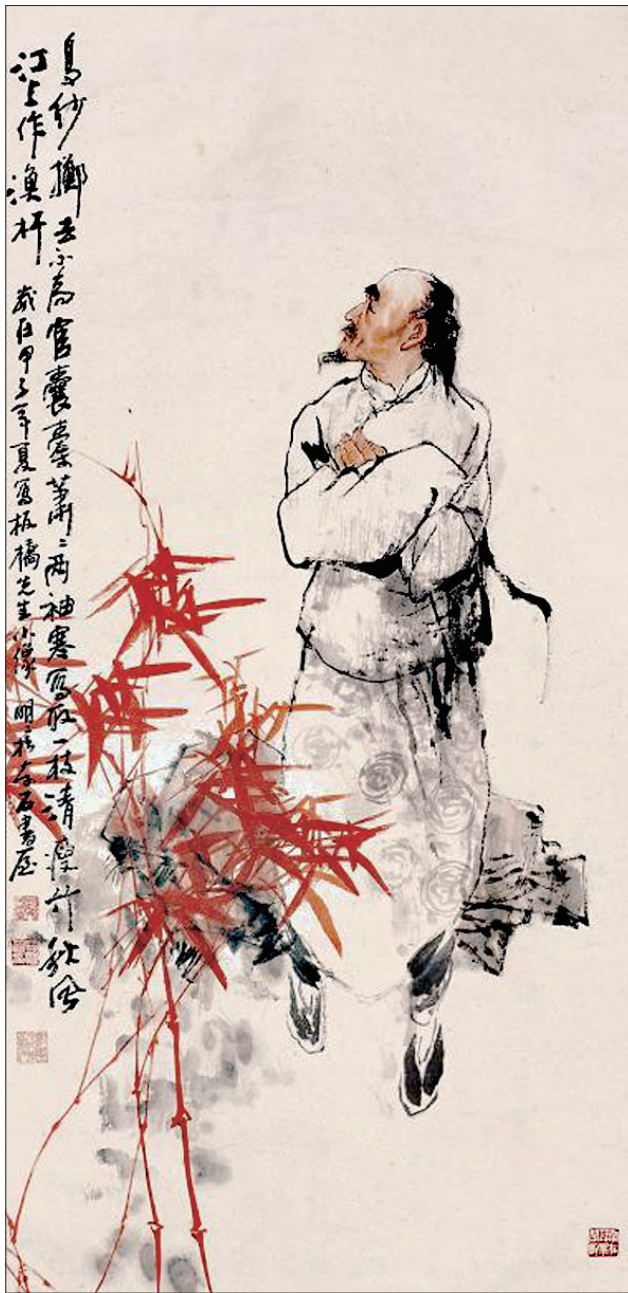
郑板桥的咏雪诗里有着数字的对仗