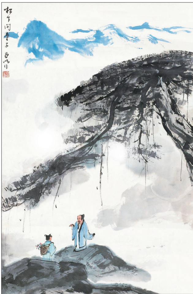
松下问童子（亚明绘）