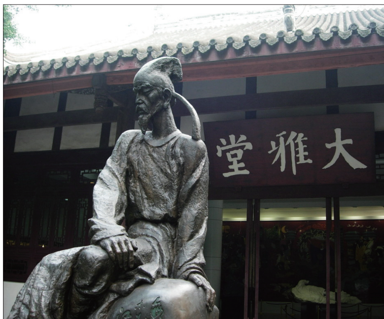
杜甫草堂；杜甫的登高诗里也有数学。