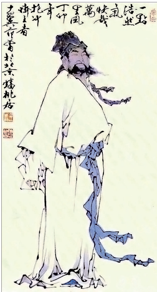
宋代大词人苏轼（范曾绘）