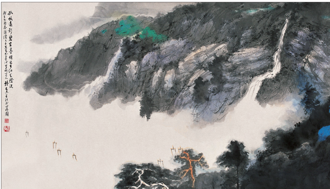
孤帆远影碧空尽：无限的概念。（钱来忠绘）