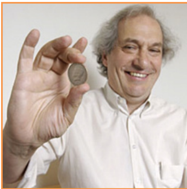
斯坦福大学的统计教授笛阿孔尼斯掷硬币可以掷出任何给定的概率；因为他从 14 岁到 24 岁都是在各地巡回演出的职业魔术师。

笛阿孔尼斯是数学界很传奇的人物。他能准确地掷出头尾是因为他从 14 岁到 24 岁都是在各地巡回演出的职业魔术师。24 岁时他想弄清楚一些组合游戏里面的原理，就请人