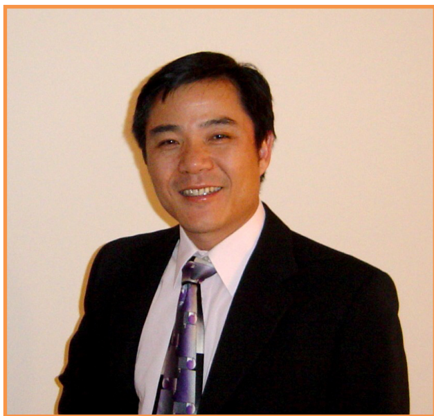
本科毕业于复旦大学的范剑青现在是普林斯顿大学统计系讲座教授，2000年COPSS统计大奖获得者。

都是围绕这个问题在展开。其中很多方法涉及到很深的数据分析知识（比如非负矩阵分解），对我这种有数学背景的人正对胃口，所以这种报告我几乎都去听。这也算是我现在的工作中最接近前沿的了。