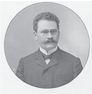
闵可夫斯基 (1864-1909), 德国数学家

告，伯克霍夫（Birkhoff）是他的好朋友，讲座结束之后，就问他最近在普林斯顿大学有没有什么有意思的东西。莱夫谢茨说有一个人刚刚证明了四色猜想。伯克霍夫严重地不相信，说要是这是真的，就用手和膝盖，直接爬到普林斯顿大学的 Fine Hall 去。Fine Hall 是普林斯顿大学的数学楼。