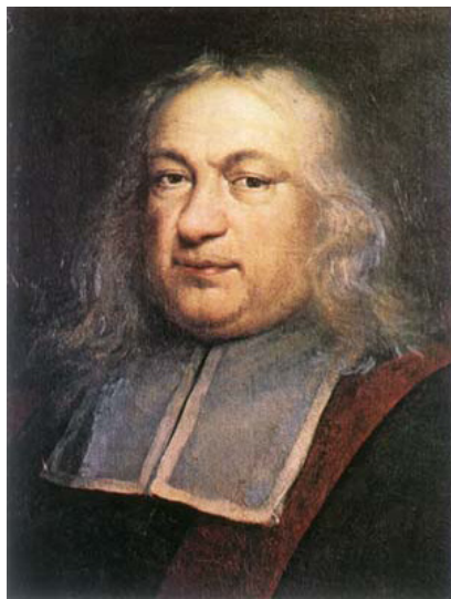
费尔马 (? -1665), 法国数学家、法学家

有一个人叫做沃尔夫凯勒（Paul Wolfskehl），大学读过数学，痴狂地迷恋一个漂亮的女孩子，令他沮丧的是他无数次被拒绝，感到无所依靠，于是定下了自杀的日子，决定在午夜钟