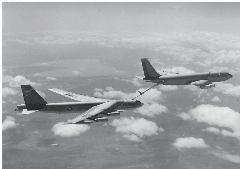
图 1. 正在接受 KC-135 空中加油机加油的 B-52 轰炸机，中间的连接部分就是加油机伸出的加油杆

然而，意外就在这个时候发生了：有一架轰炸机在接近加油机时飞得太快了，以至于后者根本来不及做出反应，这两架飞机就在 9000 多米的高空相撞。空中加油机伸出的加油杆撕裂了这架 B-52G 轰炸机的左翼，机翼断裂产生的火星引燃了加油机上的燃油，把两架飞机炸成了一团火球，100 多吨燃烧的飞机残骸散落在了地中海附近一个名叫帕洛马雷斯（Palomares）的西班牙小村庄里，与飞机残骸一同落到地上的，还有那四颗氢弹中的三颗。