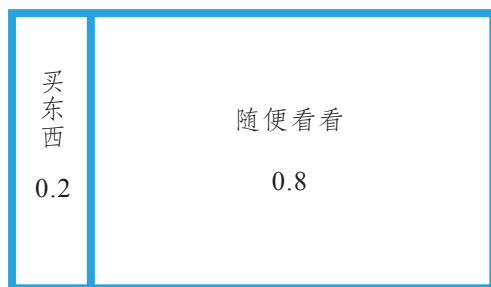
图 2. 根据店员的经验将顾客分成两类

根据贝叶斯定理，首先需要根据店员往日的经验，看看这两类顾客（“买东西”和“随便看看”）大致的分配比例。假如根据店员的经验，这两类顾客的比例大致为 1 : 4，那么我们可以画下面这样一张图（见图 2）：