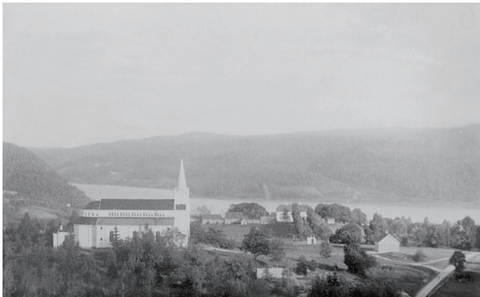
明信片上的杰斯塔教堂和教区，阿贝尔的爷爷和父亲于此担任牧师

亲在杰斯塔村出生并长大的，他在祖父去世后继承了牧师之职，父子俩担任杰斯塔教堂牧师共 38 年。