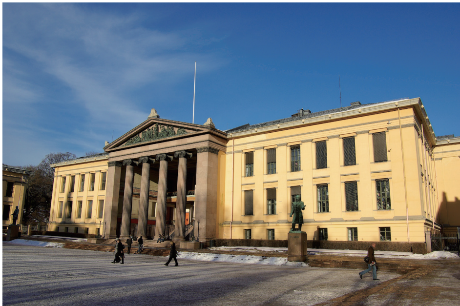
奥斯陆大学法学院。2003 开始，阿贝尔数学奖在此颁发

13 岁那年，阿贝尔离开了故乡，进了首都奥斯陆（当时叫克里斯蒂安尼亚，以丹麦国王命名）的一所教会学校。起初他的学习成绩并不突出，后来一位具有虐待狂倾向的老师因为体罚一位学生致死，被学校解雇了，继而来了一位叫霍尔姆伯（相当于德语里的洪堡）的数学老师。霍尔姆伯非常欣赏阿贝尔，他注定会成为阿贝尔的启蒙老师和第一个伯乐。