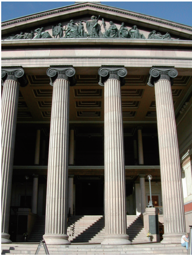
阿贝尔的母校——奥斯陆大学法学院，1989年以前，诺贝尔和平奖在此颁发

题，数学问题可以转化为代数问题，而代数问题又可以转化为方程问题。”大学时代的阿贝尔最大的野心和目标在于，历史悠久的五次或五次以上方程的求解，那是将近三个世纪以来欧洲最有才华的数学家都试图寻找的方法和结果。他们孜孜不倦地寻找着，犹如古代东方皇帝们渴望寻找长生不老的仙丹。