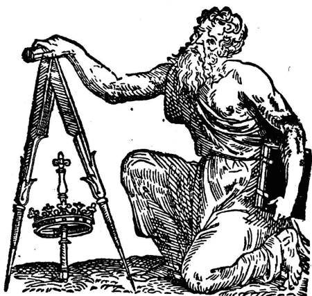
图 3. 柏拉图