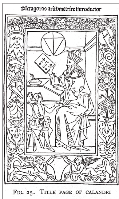
图 1. 毕达哥拉斯

15-16 世纪数学书扉页中最常见的插图是人物画像。第一类人物是古希腊哲学家, 如 15 世纪意大利数学家卡兰德里 (P. Calandri)《算术》(1491) 扉页即为木刻毕达哥拉斯画像 (图 1), 1545 年在意大利出版的《几何原本中的算术》扉页为木刻欧几里得画像 (图 2); 意大利数学家蒙约 (H. Menyos, ?-1584)《算术基础》(1566) 的扉页是木刻柏拉图画像 (图 3)。