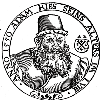
图 6. 里斯