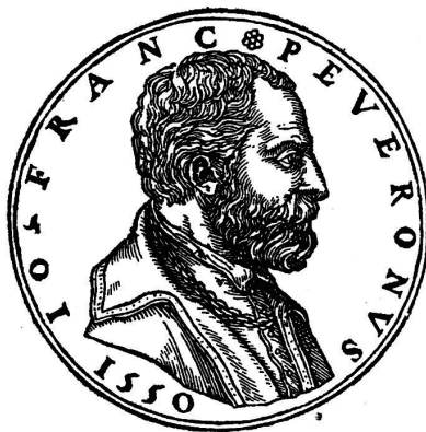
图 7. 裴弗隆