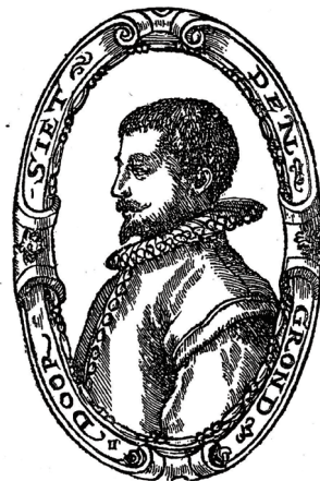
图 8. 舒尔