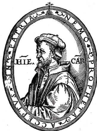
图 4. 卡丹