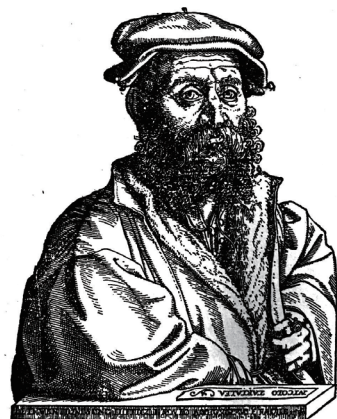
图 5. 塔塔格里亚